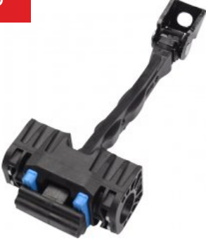
Oe Ref: 7N0 837 249 DOOR CHECK STRAP ALHAMBRA III 2011- FRONT RIGHT , FRONT LEFT