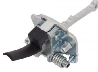
Oe Ref: 6E0837249C DOOR CHECK STRAP AROSA ( 1997 - 2004 ) FRONT RIGHT , FRONT LEFT